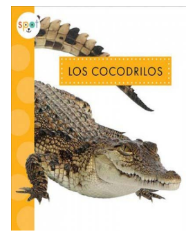
Los cocodrilos De: Mary Ellen Klukow