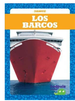
Los barcos De: Tessa Kenan